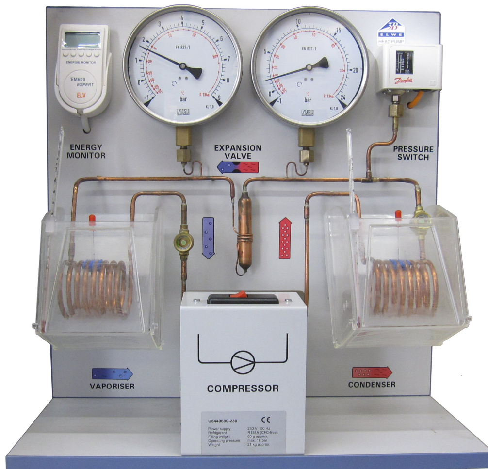
Abb.1: Wärmepumpe («pompe à chaleur»)

Das Kapitel wird hauptsächlich anhand der Informationen behandelt, die in folgendem Buch nachzulesen sind: